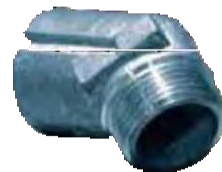
Адаптер 7545-14 45°