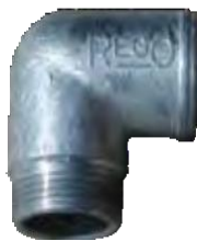
Адаптер 7545-12 90°