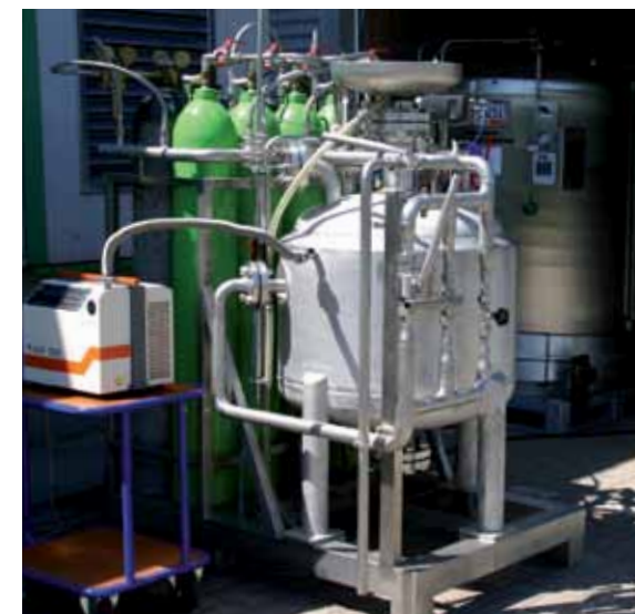
HEROSE испытательный стенд для EN 13648

Эффективное производство Гнездо предохранительного клапана распознается автоматически