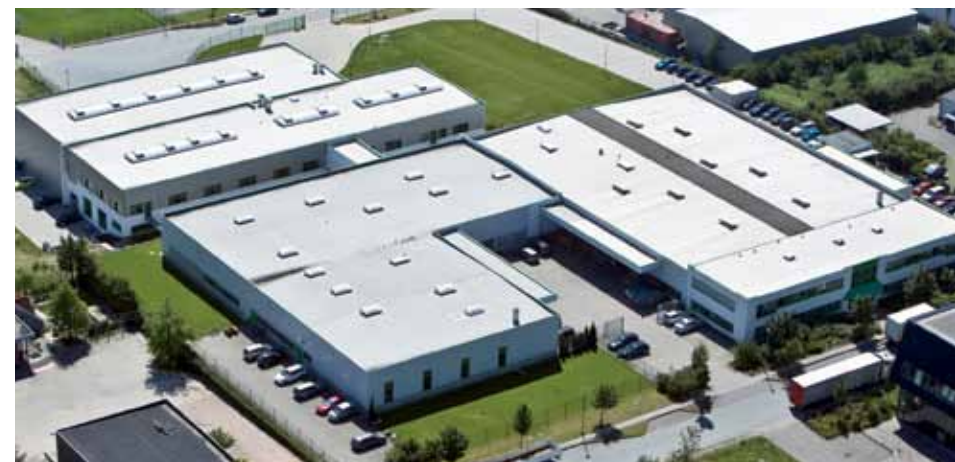
Производство HEROSE в Бад-Ольдеслоот. В HEROSE работает только высококвалифицированный обслуживающий персонал (см. выше)

Из производимых более чем 350.000 арматур в год в среднем отбраковывается менее чем 100 единиц – менее 0,03 процента.